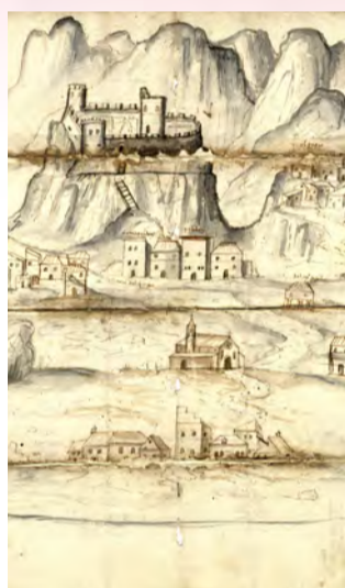
Vue du château de Corte « Modelo de la casa Polidoro » Gênes, 1541

Situé à 111 mètres au-dessus du confluent du Tavignano et de la Restonica, le château de Corte, u Castellu , fut construit en 1419 sous les ordres de Vincentello d'Istria, comte de Corse, vassal du roi d'Aragon. Occupé tour à tour par les Génois, les Français et les Corses, il abrite au XVIII e siècle une garnison de 25 à 70 hommes avec vivres et munitions.