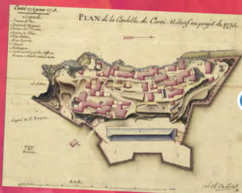
Plan de la Citadelle de Corte, relatif au projet de 1775 Chevalier du Portal Papier aquarellé, 1774 Vincennes, service historique de la Défense

En 1771, l'armée décide d'acheter toutes les maisons. C'est compter sans la résistance des habitants puisque ce n'est qu'en 1846, après quatre-vingts ans de batailles et de négociations que toutes les maisons des Castellacce passent aux mains des militaires.