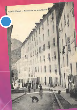
La maison des 300 propriétaires Carte postale

Ensuite parce que ce quartier situé entre la caserne Padoue et le château est une véritable enclave civile dans un domaine militaire qui empêche tout repli de l'armée vers le dernier réduit* en cas d'attaques ou d'émeutes.